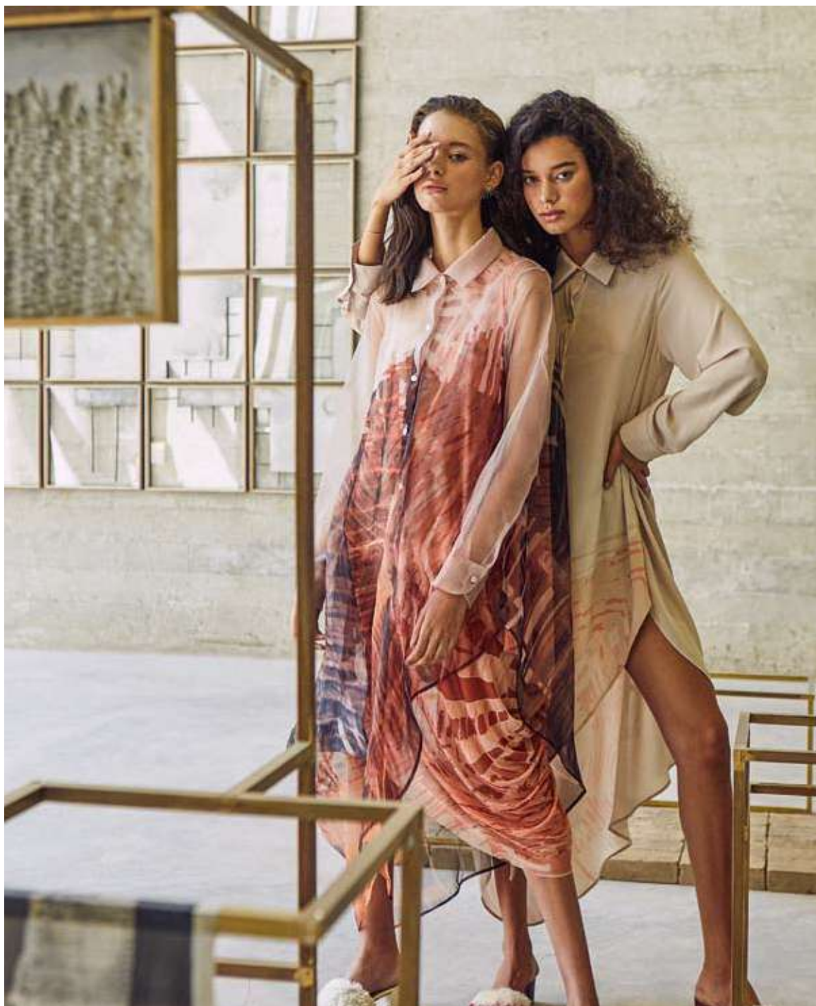
VESTIDOS CAMISEROS ESTAMPADOS DE LA COLECCIÓN “FAREWELL”.

Las creaciones de “Susan Wagner” son elaboradas a mano en el Perú con fibras orgánicas y materiales seleccionados. La visión de la marca es recrear el patrimonio y tradición textil del país a través de técnicas artesanales. Actualmente, su trabajo está enfocado en talleres de diseño ubicados en comunidades nativas de la selva amazónica; y en proyectos ambientales trabajados en conjunto con parques nacionales y empresas privadas con la misión de detener la deforestación. La nueva colección de la marca, “Farewell”, es un tributo a las especies en riesgo.