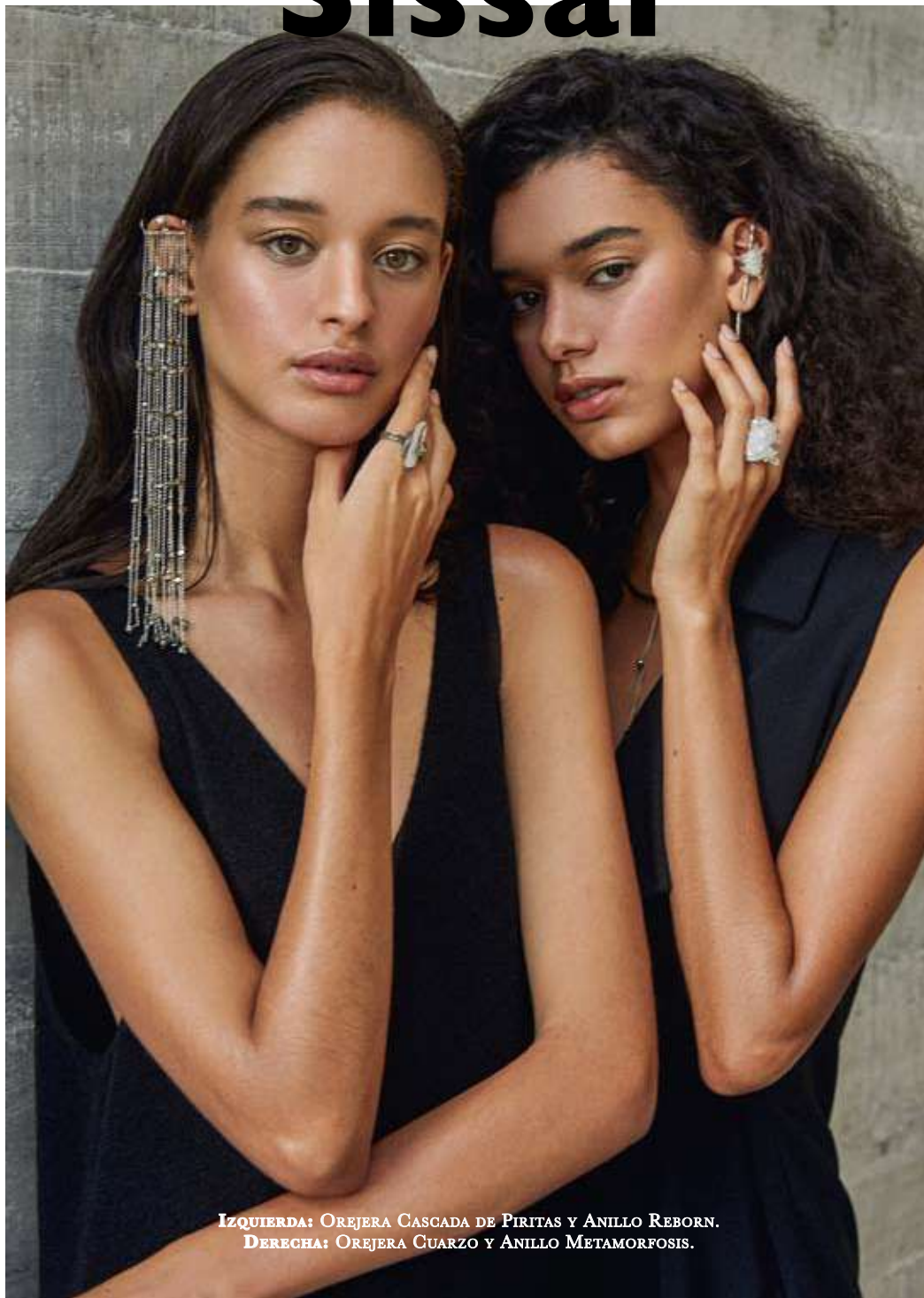
IZQUIERDA: OREJERA CASCADA DE PIRITAS Y ANILLO REBORN. DERECHA: OREJERA CUARZO Y ANILLO METAMORFOSIS.