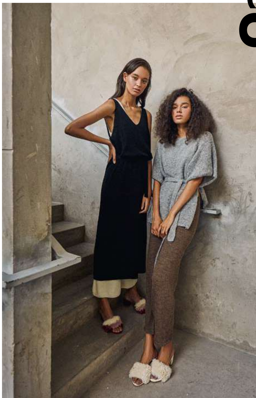
IZQUIERDA: ENTERIZO Y VESTIDO “MIA”. DERECHA: PANTALÓN “AGUS” Y PONCHO “LILA”.