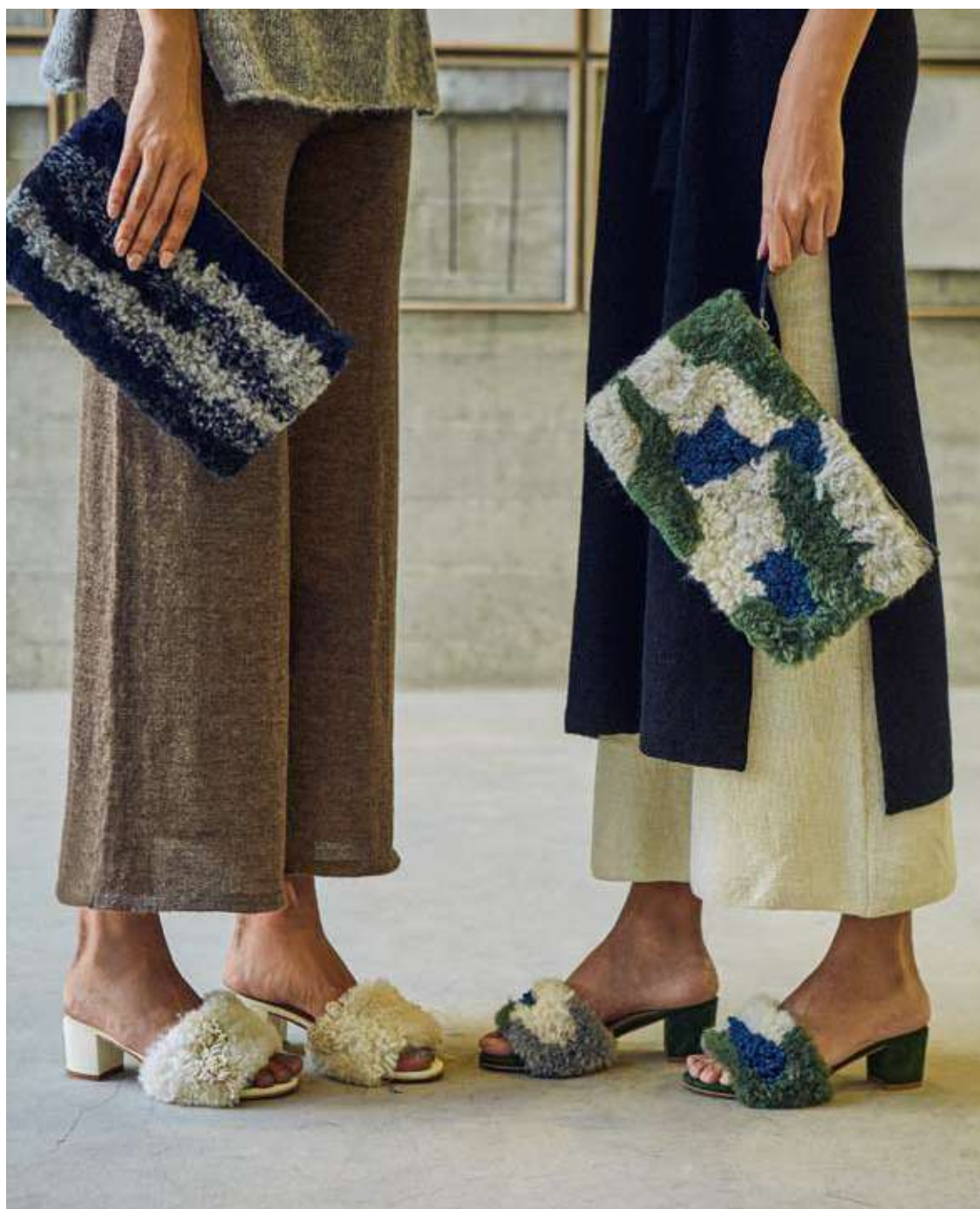
SANDALIAS IQUITOS Y CLUTCH AMAZONAS DE CORNELIO BORDA PARA AYNÍ.