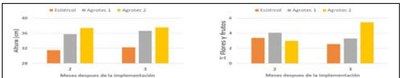
■ Figura 2: Resultados de las principales variables fisiológicas, altura y producción de frutos potencial [sumatorio (Σ) de las flores y frutos/planta].