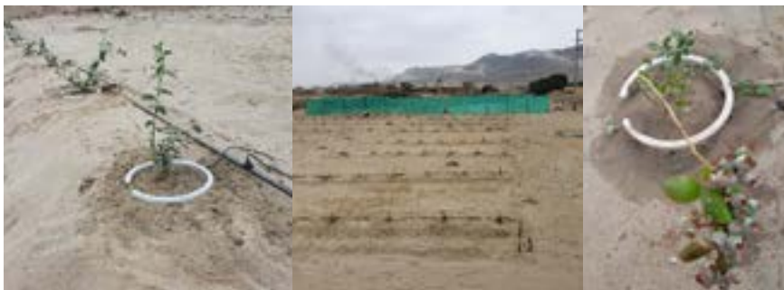
■ FRUCTIFICACIÓN: Resultado de la implementación y primera fructificación de las plantas del ensayo.

Ambos resultados son muy prometedores, pero es necesario continuar con la investigación y seguimiento. Agradecer al equipo de Inproyen y al Ministerio de Producción por impulsar la investigación y desarrollo.