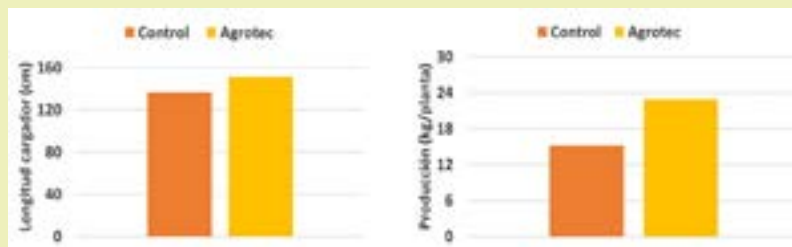
■ Figura 2: Resultados de la longitud de la rama cargadora al 95% de su desarrollo (izquierda) y de la producción por planta (derecha).

tradicional, consiguiendo mantener incluso a final del cultivo incrementos de más del 35% en el contenido de materia orgánica , más del 20% en N y un incremento de la producción del 50% .