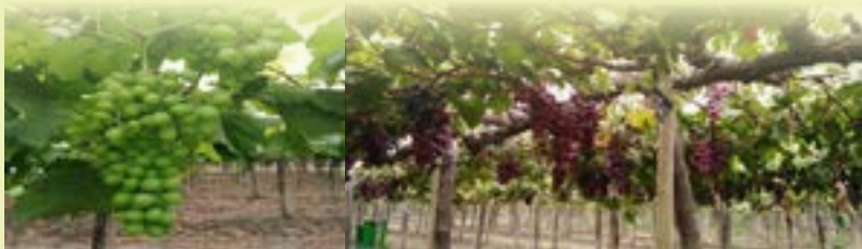
■ BUENA PRODUCCIÓN: Vid variedad Red globe en las diferentes etapas del cultivo.

Así se consiguieron fantásticos resultados. A nivel edáfico al final de cosecha se mantienen incrementos de más del 35% en materia orgánica y más del 20% en nitrógeno y en la capacidad de intercambio catiónica (Figura 1). A nivel fisiológico se alcanzó una longitud del cargador mayor y el rendimiento final por planta se incrementó un 50% (Figura 2), incluso reduciendo un 35% en peso la cantidad de abono utilizado frente al testigo (estiércol). 1